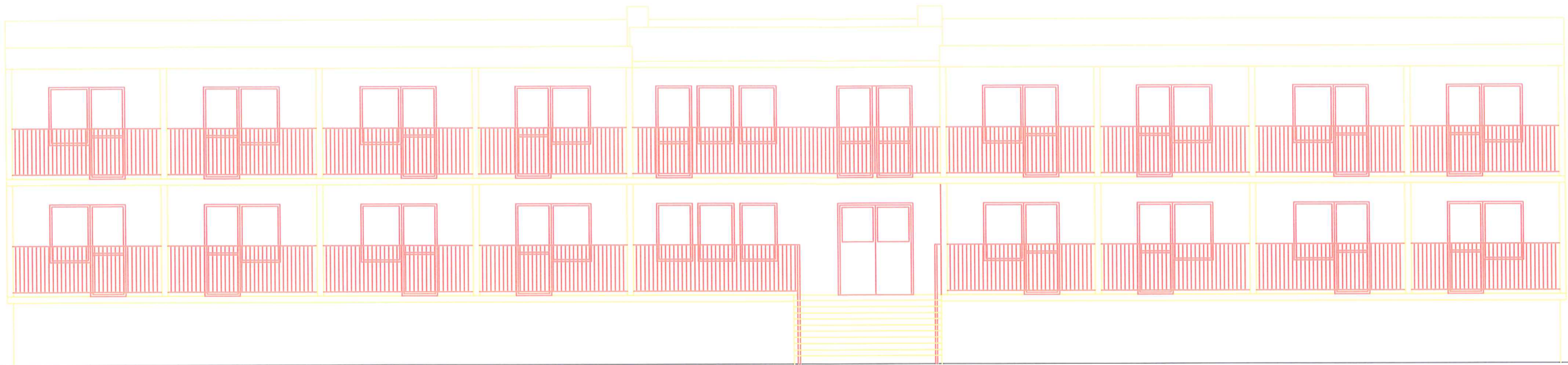
ELEWACJA FRONTOWA SKALA 1:100